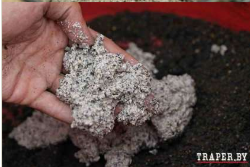
Фото: конопляное «молоко» — деликатес для рыбы! Используйте его для замеса прикормки

Как видите, вариантов использования конопли у современного рыболова есть масса, и каждый из этих вариантов может «выстрелить» в определённой ситуации. Научитесь «читать водоём» чтобы понимать, в какой ситуации какой вариант предпочесть. Это понимание даст вам несравнимо