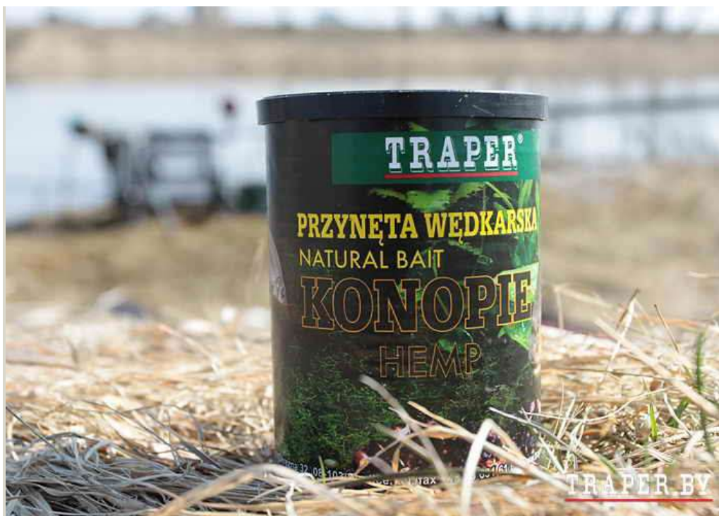
Фото: насадачная конопля, продающаяся в консервах, как правило, крупнее прикормочной, и не так сильно разварена