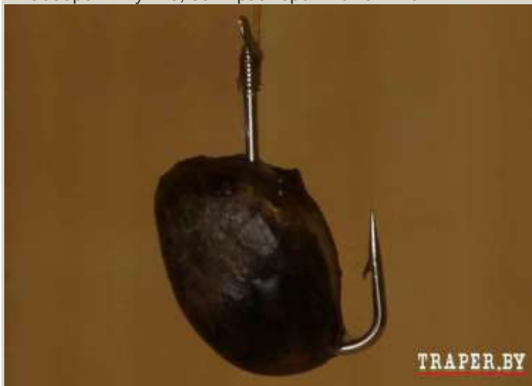
Фото: вот так конопля сидит на крючке

Учтите также, что для насаживания на крючок лучше подойдут зёрнышки более крупного размера. Существуют соответствующие сорта конопли. Некоторые производители прикормок фасуют эту коноплю в консервы. Как правило, эти зёрна не так сильно разварены. Ну а прикормочная конопля — наоборот — лучше, если размером поменьше.