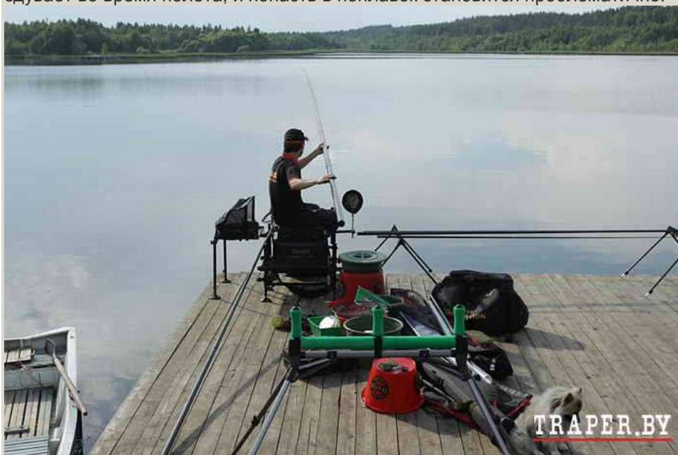
Фото: безветренный июльский день на озере с крупной плотвой. Варёная конопля не может не работать!

Кроме того, желательно, чтобы погода была тихой. Ведь чем сильнее ветер, тем больше коноплю сдувает во время полёта, и попасть в поплавок становится проблематично.